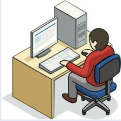
비교과프로그램 운영 학과(전공), 단과대학