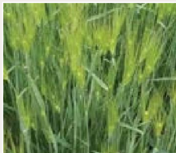
순수한 자연의 원료로 만들어집니다